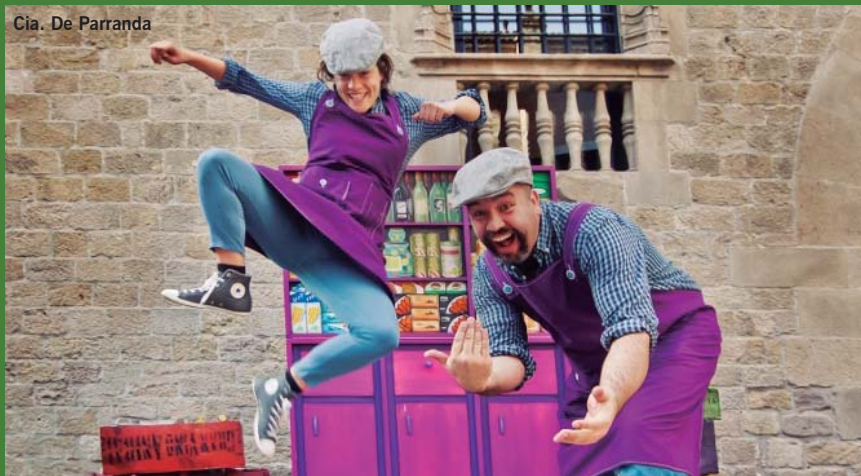
Cia. De Parranda