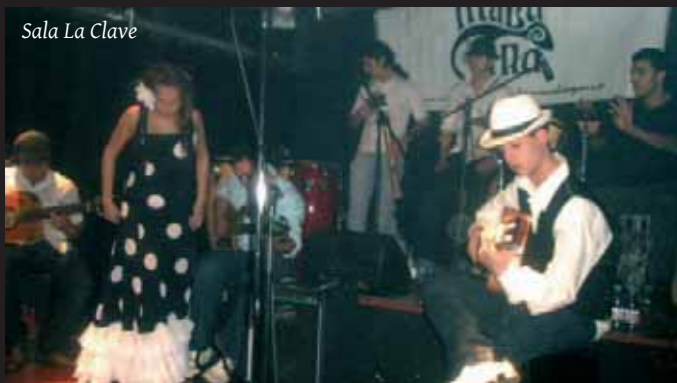
Sala La Clave

Cada diumenge al vespre, a partir de les 20 h, la sala La Clave recupera les històriques Bucs Sessions, en col·laboració amb La Casa de la Música de Terrassa. D'aquesta manera, els grups novells de la ciutat troben un espai al local per oferir concerts en directe i gratuïts on donen a conèixer el seu repertori. La programació estable també incorpora Jam sessions els dimecres i música en viu els divendres i dissabtes amb concerts de la Casa de la Música. Aquest mes ens recomanem el concert de The New Raemon , el divendres 24 a les 22.30 h, amb un preu de 10 euros. La sala La Clave té un aforament de 93 persones. Serveixen consumicions durant els concerts.