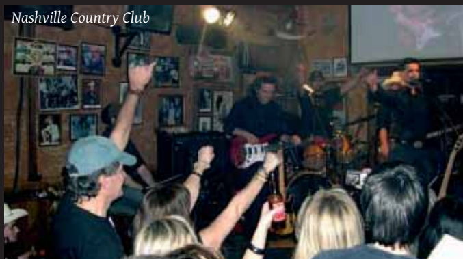
Nashville Country Club

El Nashville és la referència terrassenca del country i la cultura associada a aquest estil musical. Organitza, a banda d'un concert mensual de country, classes de ball de line-dance diàries per a diferents nivells. Disposen del "Western Saloon", restaurant que ofereix plats combinats, entrepans i carn a la brasa. Els concerts oscil·len entre els 10 i els 20 euros. La recomanació del mes és el concert de Ringo's Electric Cowboys el dissabte 18 a les 23.30 h amb un preu de 12 euros.