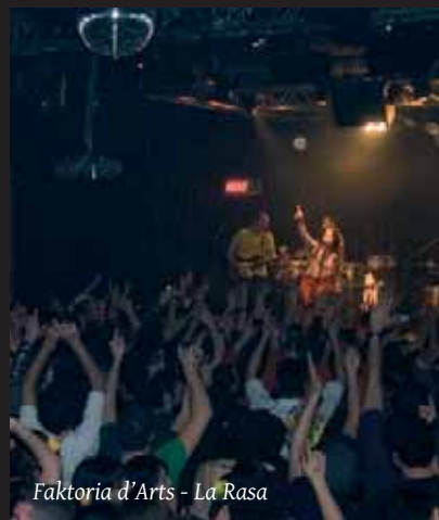
Faktoria d'Arts - La Rasa

Amb aforament per a 100 persones ofereix programació estable de concerts acústics i de petit format i col·labora activament amb