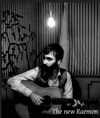
The new Raemon

la Casa de la Música de Terrassa. Durant els concerts és possible fer un àpat lleuger. L'entrada als concerts és gratuïta, excepte en els programats per la Casa de la Música. Per a aquest mes ens destaquen el concert de Rodeo Rose , el diumenge 26 a les 20.30 h, una banda de blues i southern rock.