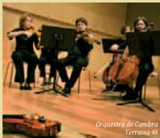
Orquestra de Cambra Terrassa 48

Orquestra de Cambra Terrassa 48 i Cor de Cambra del Palau de la Música Catalana. Auditori Municipal, 19h.